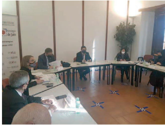
Reunión ayer del Patronato de la Fundación Estrategias. VIVA JAÉN

la décima que se suscribe desde la puesta en marcha del II Plan Estratégico de la provincia de Jaén. En concreto, para 2022, la Diputación Provincial ha previsto realizar actuaciones en 49 proyectos del II Plan; la Universidad de Jaén se implicará en 28; la Junta de Andalucía en 51; la Administración General del Estado en 10; los ayunta-