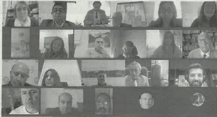
El Patronato tuvo que reunirse de forma virtual.

El presidente de la misma y de la Diputación Provincial, Francisco Reyes, señaló que, a pesar de que la Covid «no debe impedir que sigamos planificando a medio y largo plazo en la provincia». Sobre el Informe de Ejecución 2019, Reyes valoró «el trabajo de las administraciones durante el año 2019, que ha permitido el impulso de 60 de 62 proyectos del II Plan». Asimismo, el presidente puso el foco de atención en la inversión realizada por parte de la Administración Provincial, que ha impulsado 46 proyectos del II Plan en el último ejercicio y ha gestionado más de 96 millones