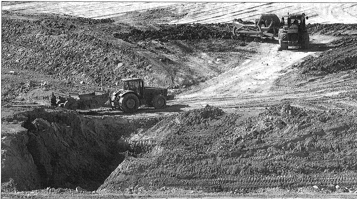
EN MARCHA. Las máquinas trabajan en el movimiento de tierra para levantar la fábrica de Dhul en el Parque Empresarial Nuevo Jaén.