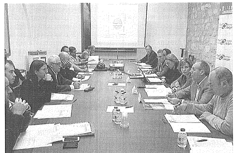
Reunión del Plan Estratégico en el Antiguo San Juan de Dios. ■ IDEAL

Otra de las actuaciones que se analizó en la reunión fue el estado de las estaciones depuradoras de